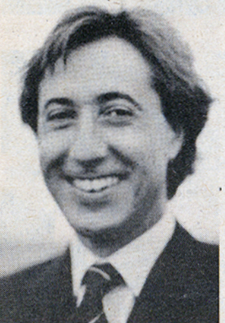
A spanyol csapat versenyzője.

HENRY HAIGH, az amerikai válogatott és egyben a világbajnoki mezőny legidősebb versenyzője, 1924-ben Michigan államban született, két gyereke van. Az USA légierejében kezdett repülni 1943-ban, majd mindig egyik második világháborús amerikai bombázón repült. 9000 órát gyűjtött utasgépeken, helikopteren, vitorlázógépeken, műrepülő típusokon